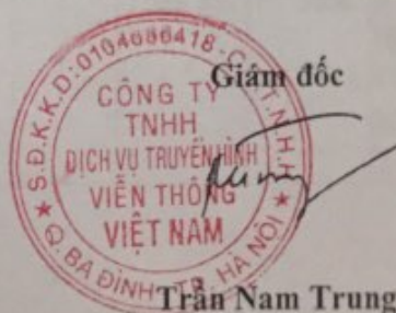
Lê Thị Xuân